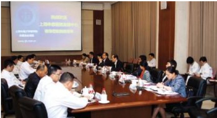
□通讯员 陈晨

本报讯 11月6日下午,上海申康医院发展中心主任陈建平、党委书记赵伟星、副主任陈方、副书记郭永瑾等党政领导班子及相关职能部门负责人一行来我院就2014年的工作情况和“十三五”发展规划工作设想开展专题调研。我院瞿介明院长、杨伟国书记率全体党政领导班子成员及