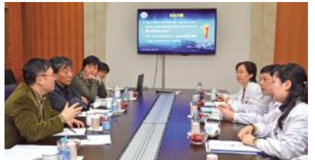
□ 通讯员 张玲

对我院为广大医护人员和患者提供了一个平安和谐的医疗、就诊环境与大力宣传消防安全给予了高度评价,并赞扬院领导对消防工作“亲手抓,直接管”,把消防安全工作做到实处。同时也提出了一些具体的建议和要求。考核组专家表示,医院消防安全防范工作关键在于平时建立长效机制。希望通过此次检查,能够督促医院进一步落实消防安全管理责任制;能够真正做到警钟长鸣,常抓不懈,确保医院安全稳定。