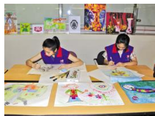
志愿者现场作画,绘出一片阳光