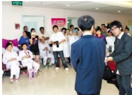
向明中学学生为乳腺外科病房患者表演节目