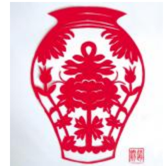
10岁小志愿者的剪纸作品