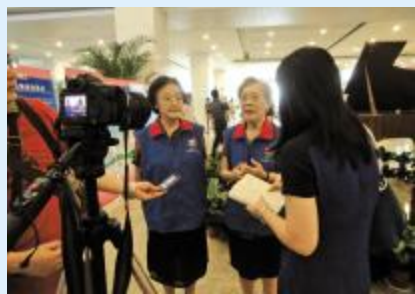
记者采访我院老年大学音乐志愿者