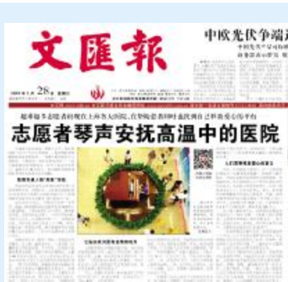
文汇报报道我院志愿者服务工作