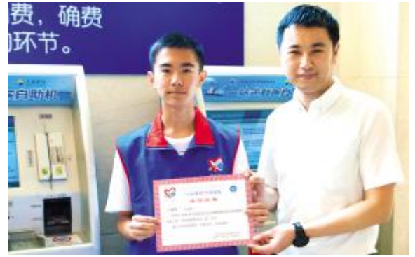
团市委副书记杨元飞为志愿者颁发证书