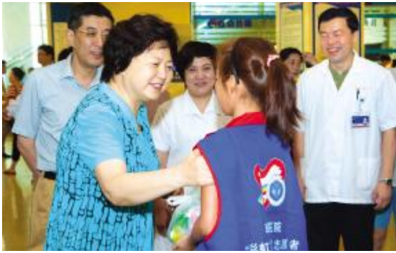
交大党委书记马德秀等校、院领导亲切慰问志愿者

他们中有为我院服务三年的社区志愿者、有老年大学钢琴班的学员、有暑期社会实践的学生、有我院的党员和入党积极分子还有职工子女们。在6月-8月间,彩虹家园志愿者服务中心共接待新报名志愿者200余人,为患者提供服务达1357人次,累计服务时间约4600小时。他们用爱心和真情架起桥梁,为医疗工作的有序开展保驾护航。