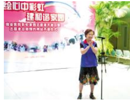
年龄最长的志愿者(82岁)和大家分享经验