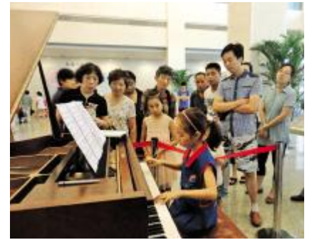
年龄最小的志愿者(9岁)在钢琴表演