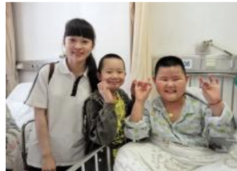
南洋中学学生看望患儿并送上幸运星