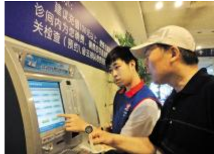
职工子女暑期志愿服务