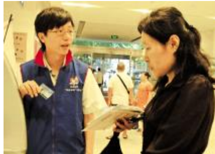
入党积极分子在门诊做志愿者