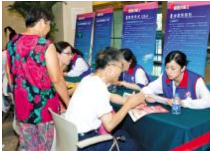
党员志愿者义诊,为患者答疑解惑