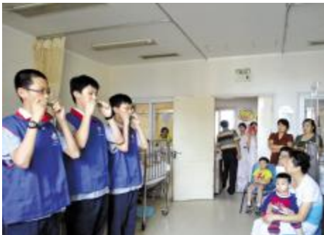
私立永昌学校的学生带着节目走进儿科病房