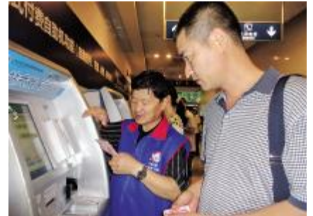
已在我院服务三年的社区志愿者