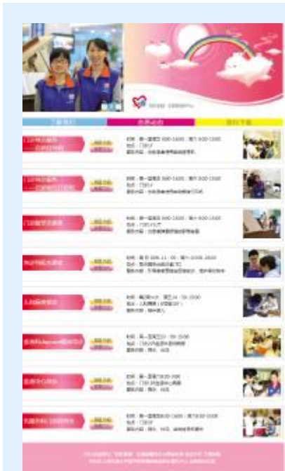
彩虹家园志愿者服务中心网站主页面