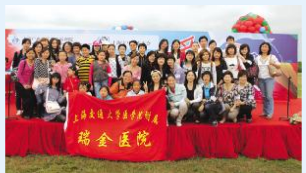
5月28日,院团委组织部分职工及职工子女到奉贤,参加上海广慈儿童福利院举行的“爱的摇篮·放飞梦想”第二届残疾儿童联谊会,与福利院的孤儿儿童及社会各界爱心团队共度欢乐的“六一”儿童节。参与本次活动的“主力军”是来自手术室的青年医护人员,他们已多次通过义诊、体检等形式为福利院的小朋友奉献爱心。 ·丁芸 张瑞贺·