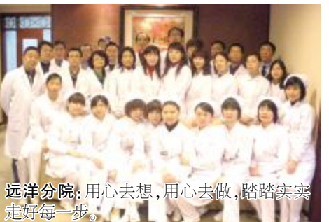
远洋分院：用心去想，用心去做，踏踏实实走好每一步