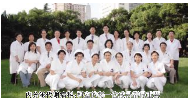
内分泌代谢病科：科室的每一位成员都很重要