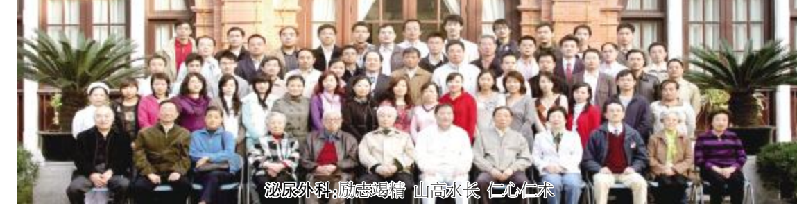
泌尿外科：励志砺精 山高水长 仁心仁术