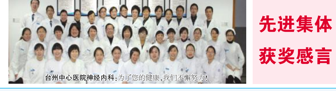
台州中心医院神经内科：为了您的健康，我们不懈努力!