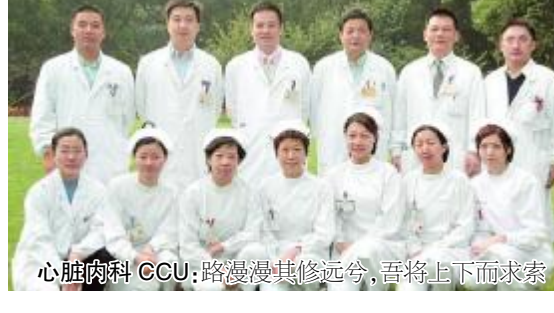
心脏内科 CCU：路漫漫其修远兮，吾将上下而求索