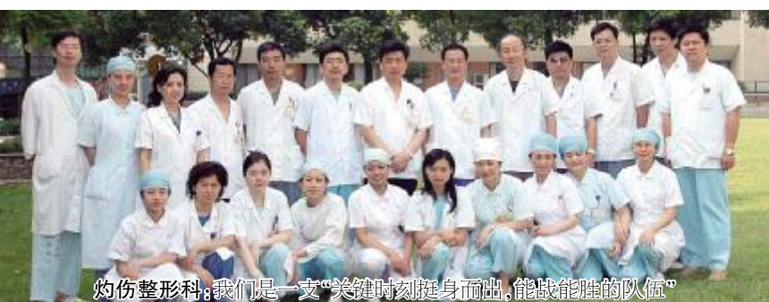
灼伤整形科：我们是一支“关键时刻挺身而出，能战能胜的队伍”