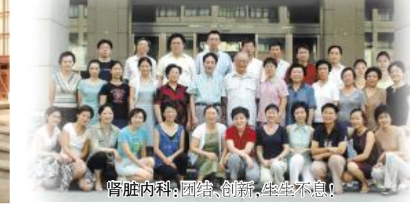
肾脏内科：团结、创新，生生不息!