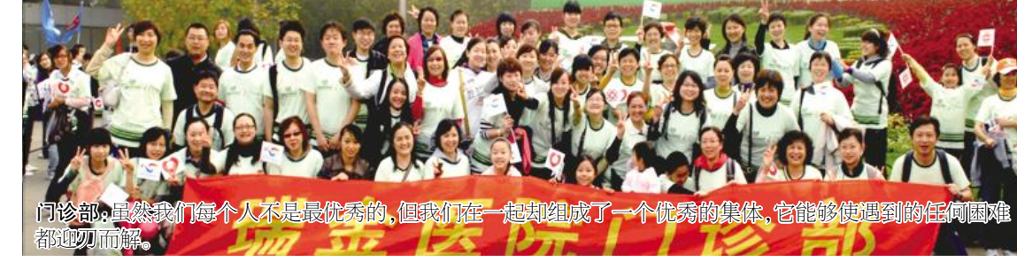
门诊部：虽然我们每一个人不是最优秀的，但我们在一起却组成了一个优秀的集体，它能够使遇到的任何困难都迎刃而解。