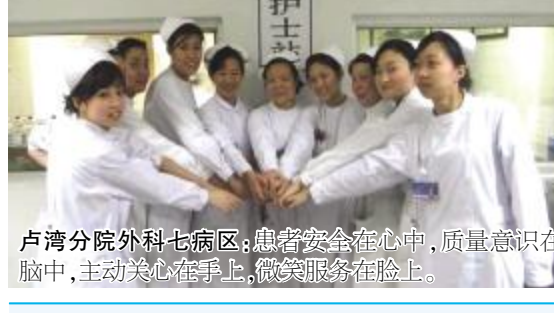
卢湾分院外科七病区：患者安全在心中，质量意识在脑中，主动关心在手上，微笑服务在脸上。