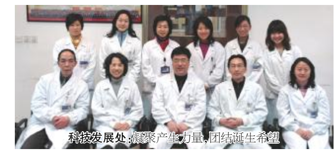
科技发展处：凝聚产生力量，团结诞生希望