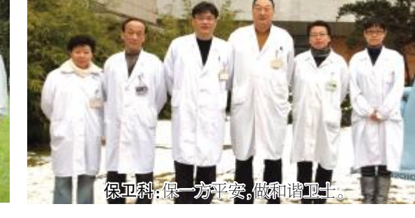
保卫科：保一方平安，做和谐卫士