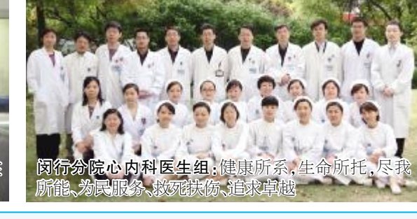
闵行分院内科医生组：健康所系，生命所托，尽我所能，为民服务，救死扶伤，追求卓越