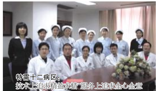
特需十二病区：技术上追求精益求精，服务上追求全心全意