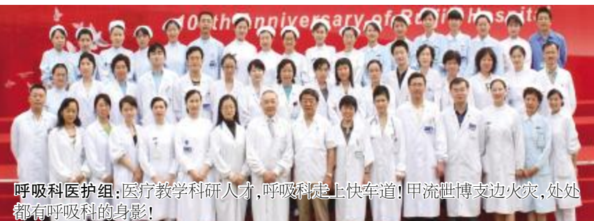
呼吸科医护组：医疗教学科研人才，呼吸科踏上快车道! 甲流世博边线火，处处都有呼吸科的身影!