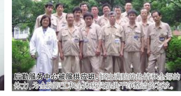
后勤服务中心被服供应班：倾注满腔的热情和全部的体力，为全院职工和全体病员提供最干净整洁的衣被。