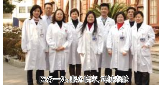
医务一处：服务临床，竭诚奉献