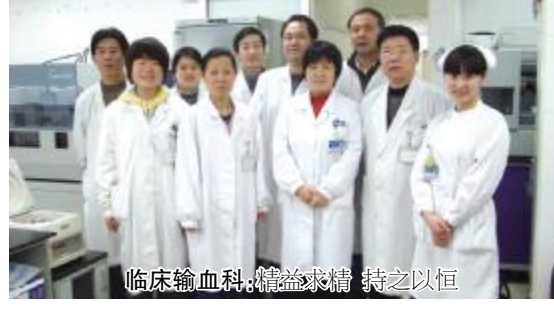
临床输血科：精益求精 持之以恒