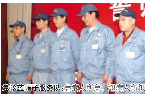
急诊蓝帽子服务队：急病人所急，想病人所想