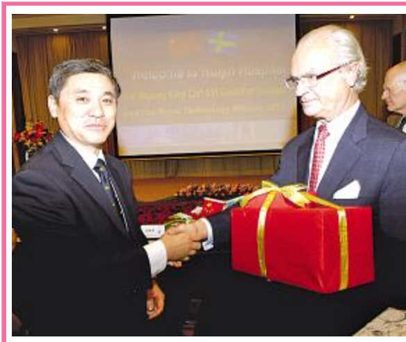
瑞典国王卡十六世·古斯塔夫率皇家工程科学院皇家技术考察团一行于十一月十八日来到我院访问，了解公立医院的管理经验，与下级医院、社区医院的合作模式等。上海市副市长沈晓明、党委书记严肃、中国工程院院士王振义、陈赛娟等共同会见了国王一行。