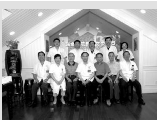
9月21日下午,“瑞金医院新老党委委员迎中秋、庆国庆茶话会”在院史陈列馆举行。我院新老两届党委委员欢聚一堂,喜迎佳节,共话医院发展。茶话会由院党委书记严肃主持。