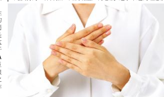
团队协作，共同进步。

另外通过参与临时医院的游戏让我对医院的整体运营情况有了更深的认识。我明白了医院的各个岗位都有千丝万缕的联系，每个岗位都有它存在的作用和意义，只有所有的岗位串联在一起顺利运行才能使整个医院顺利地开展工作，从而推广我们瑞金“广博慈爱、追求卓越”的理念。