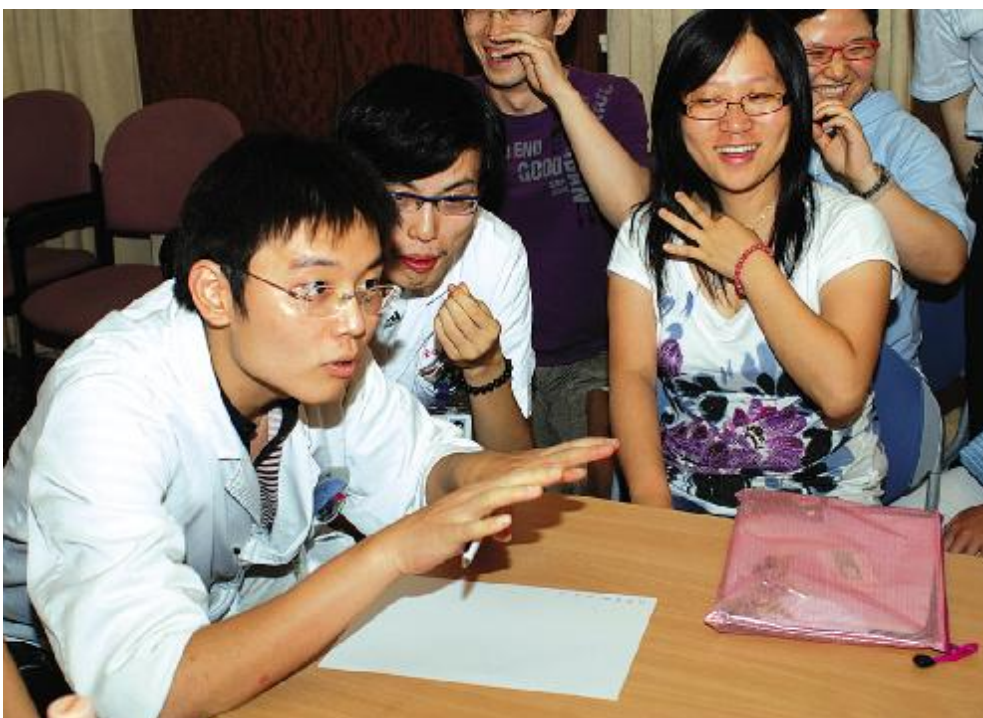
临时医院实战模拟中，大家认真聆听老师的讲解。

还记得最后一天的演出吗? 还记得我们的“天籁之音”吗? 不知我们精心准备的演出是否给您留下了深刻的印象? 不知您是否被我们真诚的歌声所打动呢? 我只知道，我们中的每一个人被自己的歌声感动，这种状态只能感悟，只能自己体验，因为我们投入，因为我们付出。When a Child Is Born——我们以此作为此次培训的谢幕之作，每每回想起来，这画面都让我感动，因为太纯粹了，像巴赫的无伴奏合唱曲，虽然并没有那么完美，但是就如我们院长所说，新星医院在我们大家心目中是永远的第一。