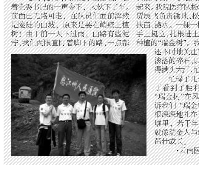
云南医疗队队员在植树活动现场合影。